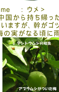
アブラムシがついた梅