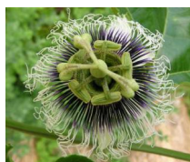
パッションフルーツの花