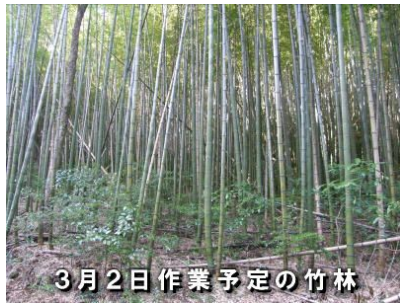
3月2日作業予定の竹林

こうした森林竹林を協働で整備するだけでなく、皆が一緒に楽しめる里山に広がる豊かな「くらし」の空間づくりを提案できることも大事な目標です。あなたも参加しませんか。それぞれの出来ることから始めましょう。