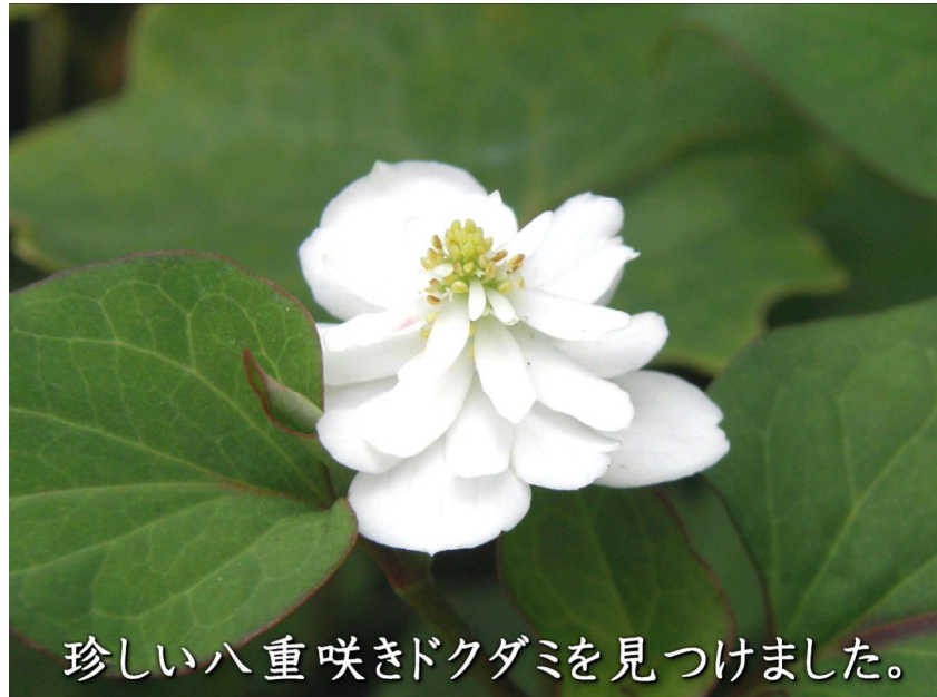
珍しい八重咲きドクダミを見つけました。